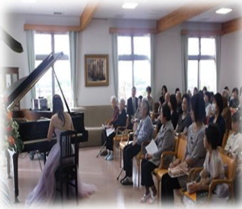
音の余韻に「うっとり」♪