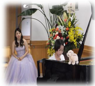
リトルピアニスト♪